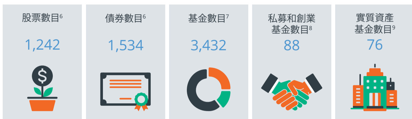
圖4：可持續資產的投資領域

不同資產類別均提供可持續投資機會，由股票、債券，以至專注影響力投資的另類投資，例如私募基金、創業基金和實質資產基金。