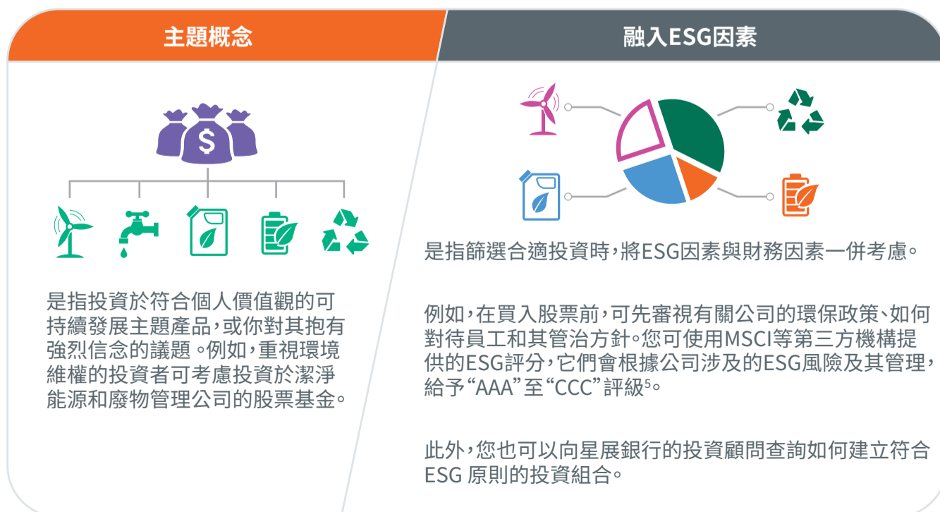
圖3：如何把可持續發展融入投資組合