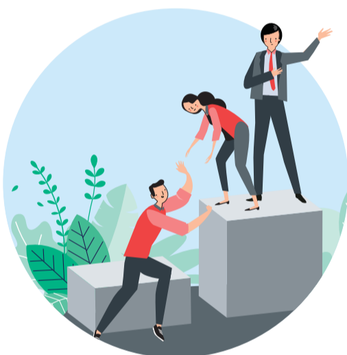
圖5：社會和管治因素亦對風險管理和表現發揮重要作用

也許氣候變化及其實質影響廣受關注，因此在“ESG”當中，“E”（環境）因素最為人熟悉，但可持續投資同樣重視「社會（S）」和「管治（G）」因素。